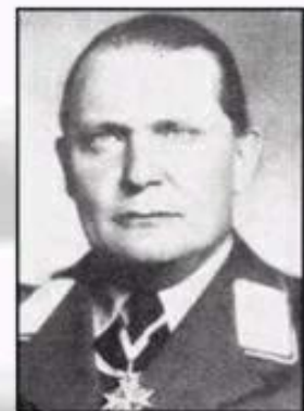
Hermann Goering, Hitler's Reich-Marshal at the Nuremberg Trials after WWII

"Naturally, the common people don't want war, but after all, it is the leaders of a country who determine the policy, and it is always a simple matter to drag people along whether it is a democracy, or a fascist dictatorship, or a parliament, or a communist dictatorship. Voice or no voice, the people can always be brought to the bidding of the leaders. This is easy. All you have to do is to tell them they are being attacked, and denounce the pacifists for lack of patriotism and exposing the country to danger. It works the same in every country."